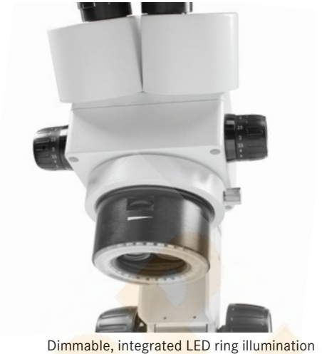
Dimmable, integrated LED ring illumination