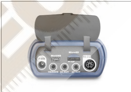
... and data transfer using MicroSD (4G) memory card (included in delivery), RS-232 or USB