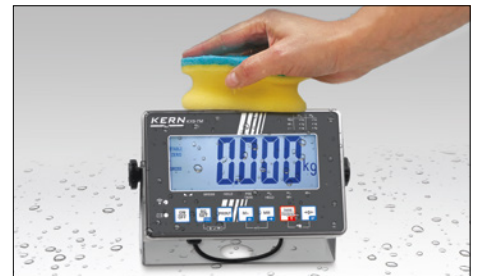
Stainless steel display device with protection IP68, hygienic and easy to clean