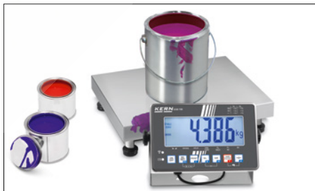
Durable stainless steel weighing plate