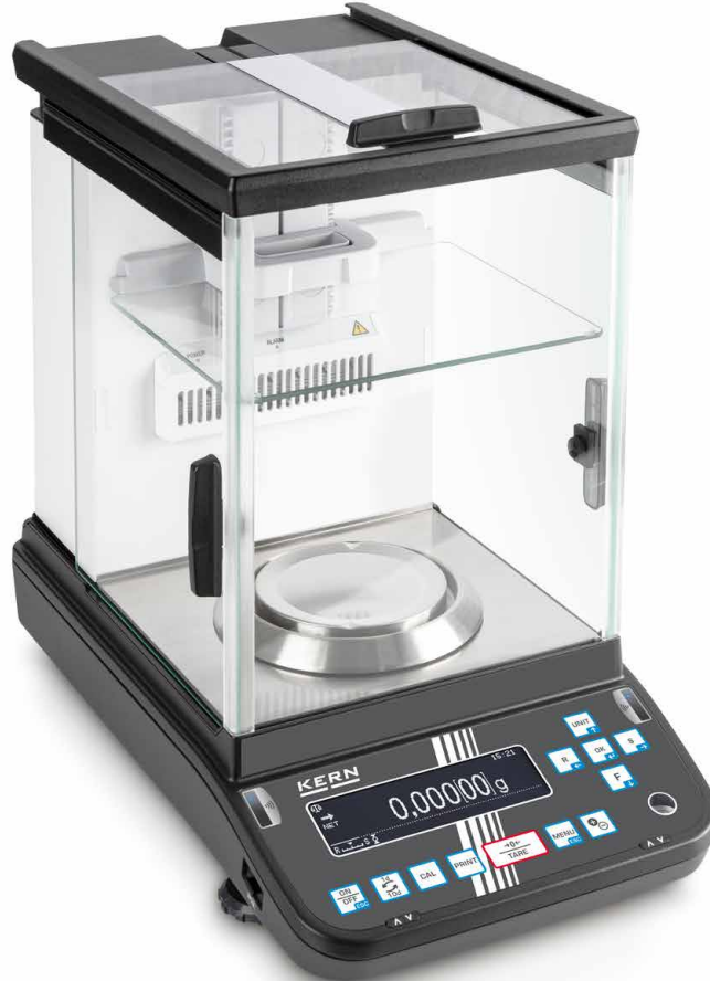
KERN ABP-A with integrated ioniser and internal draft shield