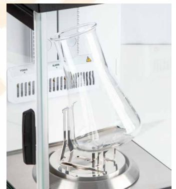
Erlenmeyer piston holder, included as standard with ABP 200-5M and ABP 200-5AM