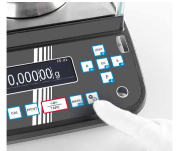
Ioniser (included) can be activated at the touch of a button