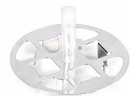
Multi-function weighing plate, Note: included with delivery for models with [d] = 0,01 mg