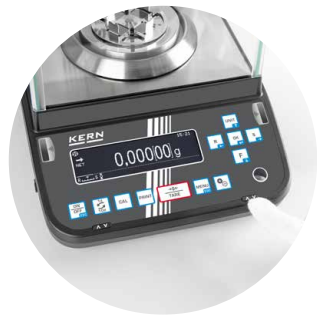
Opening possible alternatively via button