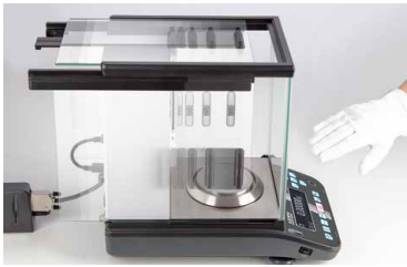
Automatic sliding doors, which can be opened and closed using sensors