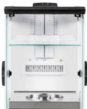
Internal draft shield - minimises the effect of air currents in the weighing chamber, only for 0.01 mg models of the series ABP-A