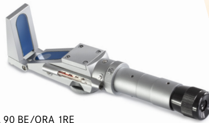
ORA 90 BE/ORA 1RE