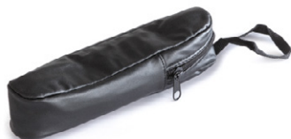
Leather bag ORA-A2103