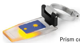
Prism coverplate with LED ORA-A1101