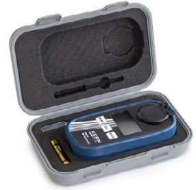
Transport and storage case