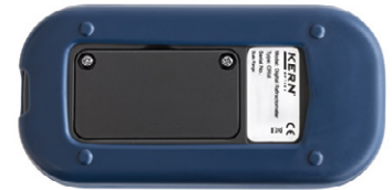
Rear view, screw-on battery compartment cover