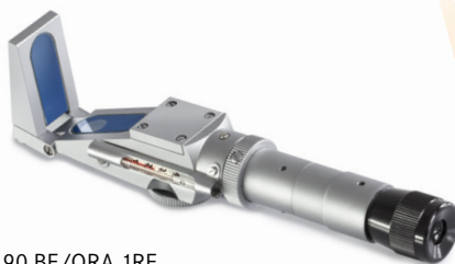
ORA 90 BE/ORA 1RE