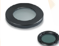
Simple polarising attachment